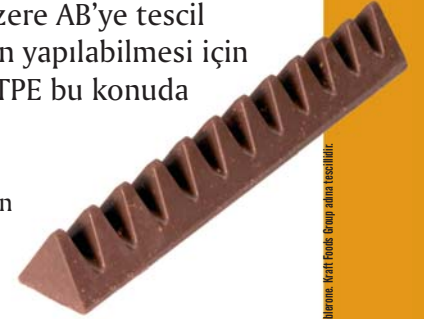
Taberone Waft Foods Group adına tescillidir.

İsviçre çikolataları, ürünün coğrafi kaynağını gösteren coğrafi işaretlere iyi bir örnektir. İsviçre'de üretilen çikolataların tatları ve kalitelerinin, İsviçre'ye özgü karakteristik özelliklerinden dolayı, belirli bir standardı karşılaması beklenir. Coğrafi işaretlere ilişkin diğer iyi örnekler Jamaika'nın kahvesi ve Meksika'nın belli bölgelerinden gelen tekiladır.